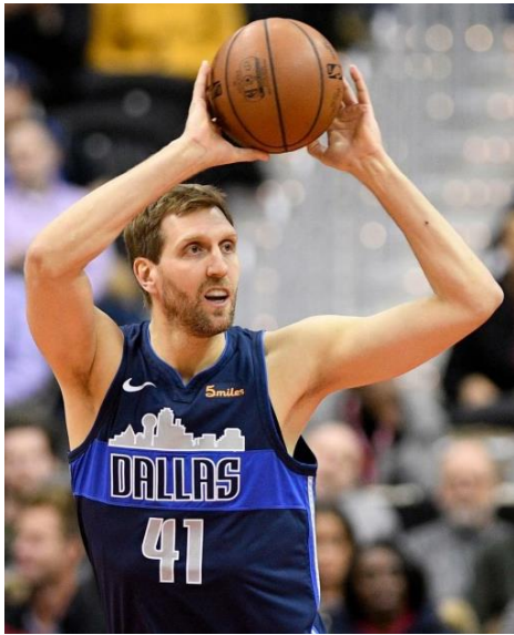
Dirk Novitzki (*1978) erfolgreichster deutscher Basketballer